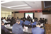
中共中央党校 姜平

为进一步拓宽工作思路、创新管理理念，2日下午至3日上午，龙信集团组织专题培训，邀请中共中央党校教授姜平、国家税务总局扬州税务学院客座教授赵国庆进行授课。姜平教授结合当前宏观经济形势，对房地产业发展走向进行判断，并从“12个引领”方面对企业未来发展给予建议，赵国庆教授对后营改增时代税制改革及税收征管趋势进行分