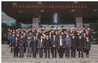
中共龙信建设集团有限公司第六次党员代表大会合影

龙信集团通过长期积累与探索，不断完善基层组织体系、党建管理体系和运营考核体系，形成具有特色的龙信党建工作法。党建+企业发展，增强了企业竞争力；党建+生产经营，提高了企业生产力；党建+企业文化，强化了企业凝聚力；党建+群团工作，进一步形成工作合力；党建+人才发展，引领队伍建设提升竞争力。随着企业党建工作与各项业务建设深度融合，“诚信做人，务实做事，持续创新，追求高效，合作共赢”的核心价值观不断深入人心。公司人才辈出，现有省、市、区人大代表、政协委员近十人，享受国务院特殊津贴的高水平人才两人，以党员为核心的各类专业技术人才活跃在公司不同岗位上，成为事业发展的骨干力量。